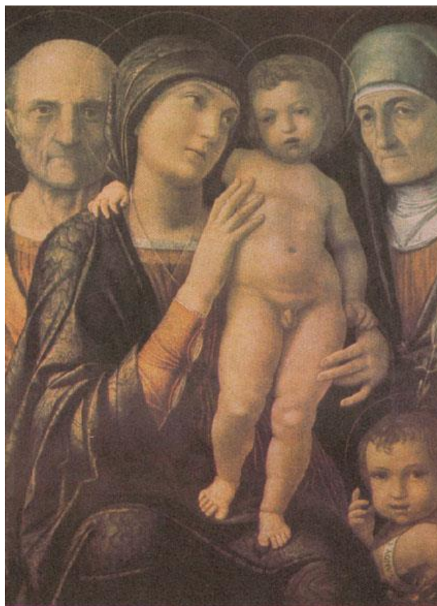
Manteņa. Svētā ģimene