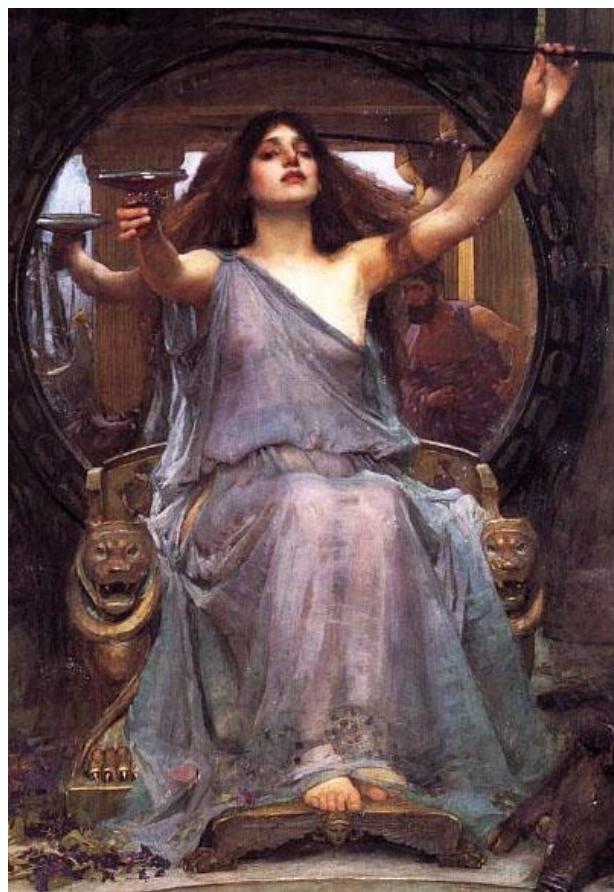
Kirke sniedz kausu Odisejam Džona Votterhauza glezna