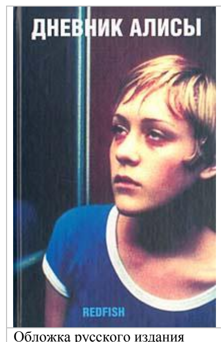
Обложка русского издания