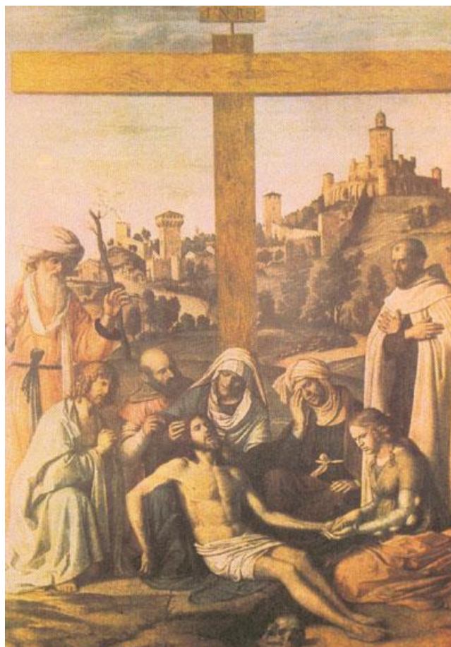
Дж. Батиста. Снятие с креста