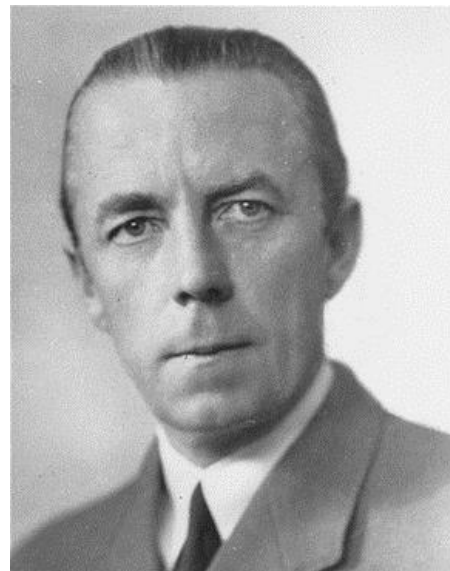
Count Folke Bernadotte of Wisborg (1895.01.02 – 1948.09.17)

(этого последнего граф Бернадотт также не нашел нужным оспорить). Нокраши-паша добавил, что и арабы не рассчитывают избежать этого господства. Однако, еврейское экономическое господство в Палестине – это одно дело; с чем арабы не намерены примириться и против чего они будут бороться, это – попытка основать с помощью насилия и терроризма, и с помощью международного сионизма, сионистское государство, основанное на принуждении. Король Фарук заявил Бернадотту, в свою очередь, что если война будет продолжаться, то она превратится в третью мировую войну. Граф Бернадотт согласился и с этим, сказав, что именно поэтому он и принял на себя роль посредника в Палестине. Он указал также, что во время войны ему «удалось спасти около 20 000 человек, среди них многих евреев; я лично руководил этой задачей» . Очевидно, он полагал, что заслужит этим уважение с сионистской стороны, однако он жестоко ошибся. В течение немногих дней (9 июня 1948 г.) ему удалось уговорить арабов согласиться на перемирие без предварительных условий, однако немедленно же последовали яростные нападки на него сионистов за то, что он «вынудил евреев к перемирию».