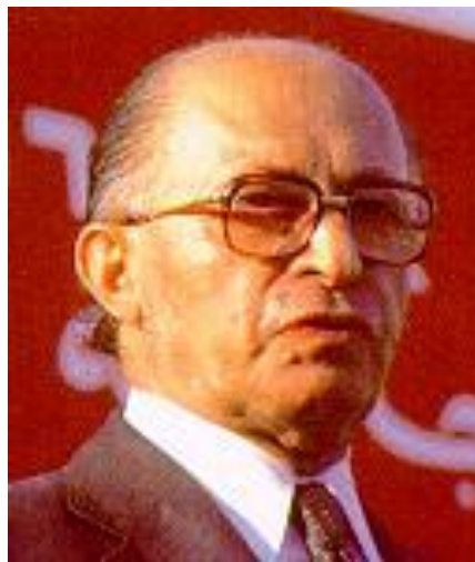
Menachem Wolfovich Begin (1913.08.16 – 1992.03.09; Брест-Литовск – Тель-Авив) 55

В последующие годы, вплоть до настоящего времени, Бегин продолжал свои кровожадные выпады против соседних арабских государств. Еврейская газета «Зионист рекорд» в Йоганнесбурге (Южная Африка) писала 20 августа 1954 г.: