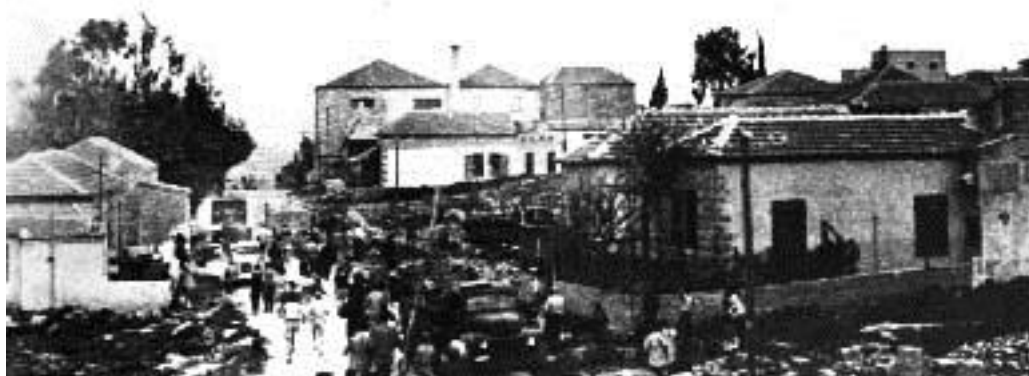
Дейр-Ясин того времени

«Еврейские террористы из организации «Банда Звезды» и «Иргун Цвай Леуми» ворвались в деревню Дейр-Ясин, перебив всё население. 250 арабских трупов, главным образом женщин и малых детей, были затем обнаружены брошенными в колодцы».